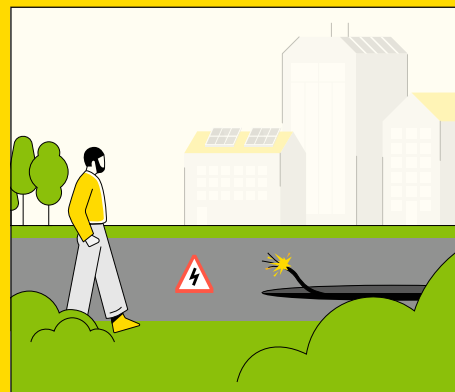
Cabos à vista, em locais acessíveis