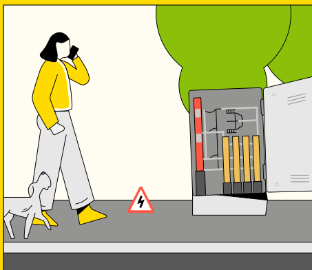
Armários elétricos abertos ou danificados